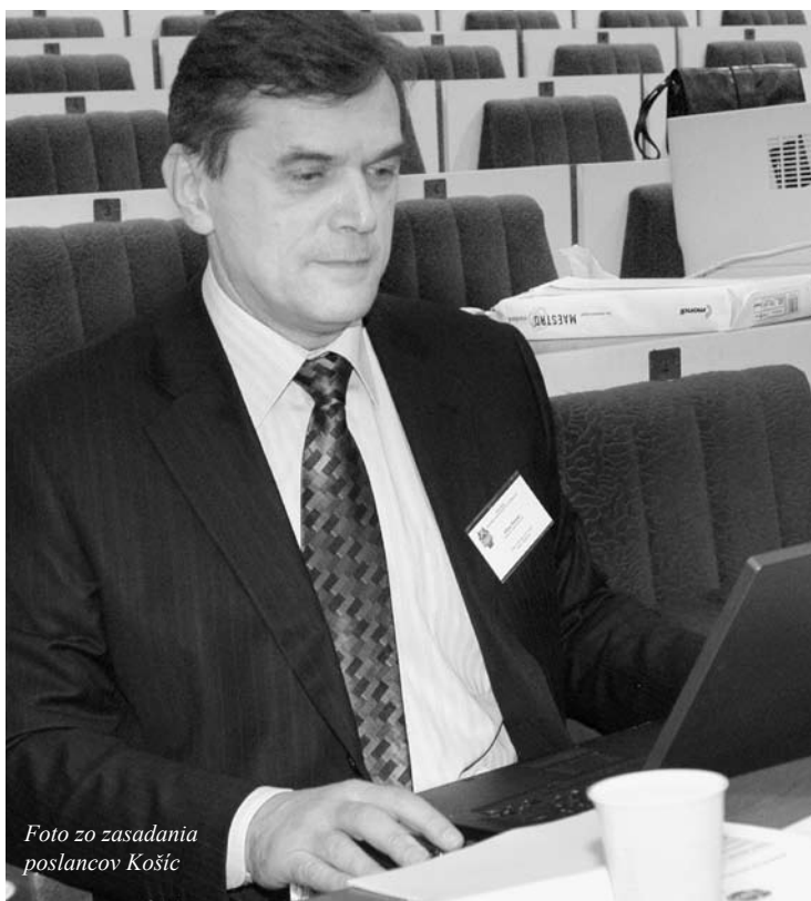
Foto zo zasadania poslancov Košíc